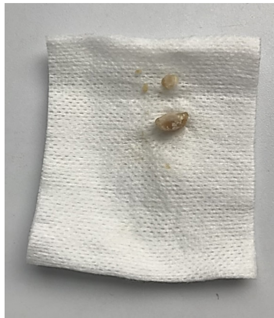
Imagen 2. Cuerpo extraño. Cuerpo extraño extraído (maní) de aproximadamente 0.8 cm de largo.