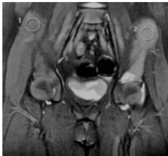
Figura 1 – Resonancia magnética de pelvis. En secciones coronales de los huesos de la cadera derecha (1) y los tejidos blandos no se muestra cambios. Lesión neoplásica primaria en hueso iliaco izquierdo (2).

Reporte de biopsia consistente con SG. La inmunohistoquímica mostró positividad para Mieloperoxidasa (MPO), CD117, Y CD3 en algunas células; CD34 negativo. Se realiza aspirado de médula ósea, descartando Leucemia Mielóide Aguda (LMA). Se inicia quimioterapia intravenosa con Citarabina 100 mg/m 2