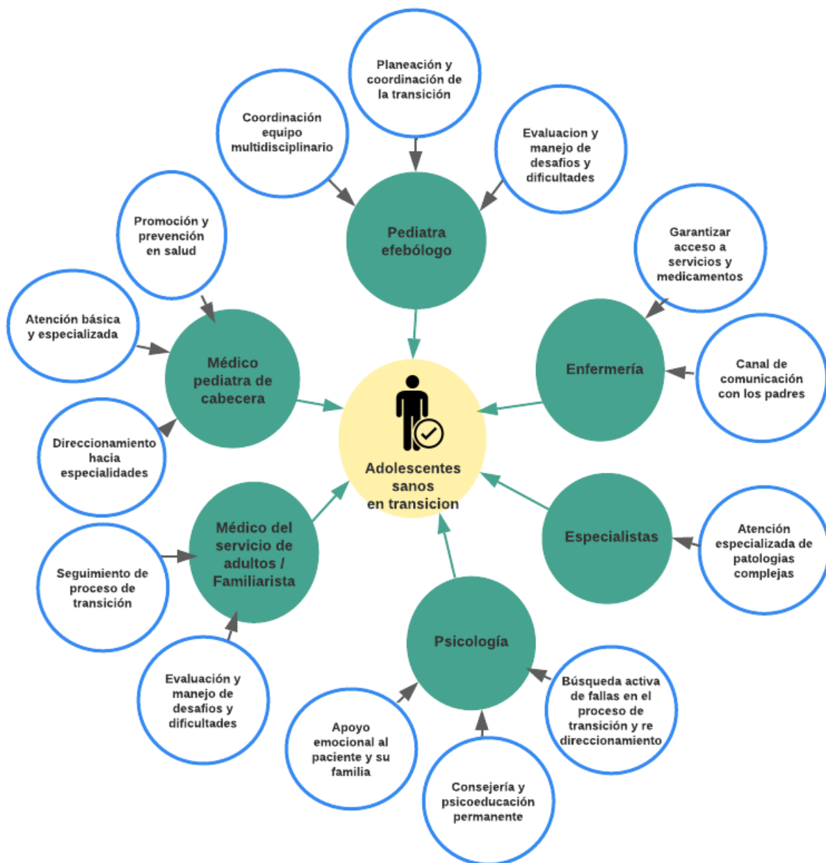
Figura 2. Equipo multidisciplinario de la transición.

Estas oportunidades deben ser interpretadas por todos los actores del sistema de salud: Médicos, auditores, gerentes de salud, demás profesionales de salud y personal afín a las áreas administrativas que se encargan de plantear políticas de salud pública para adaptar las oportunidades en realidades.